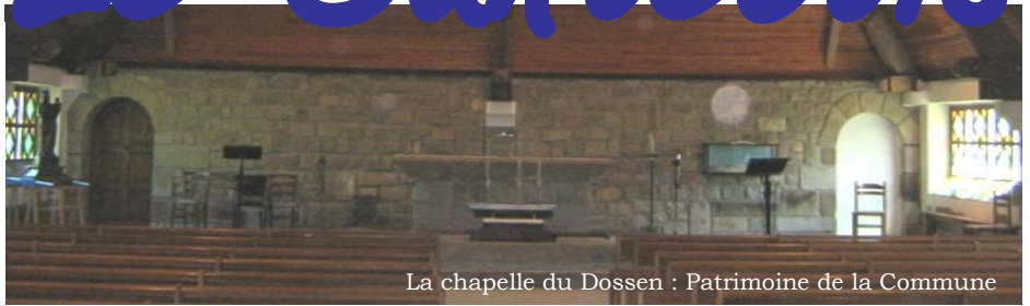
La chapelle du Dossen : Patrimoine de la Commune