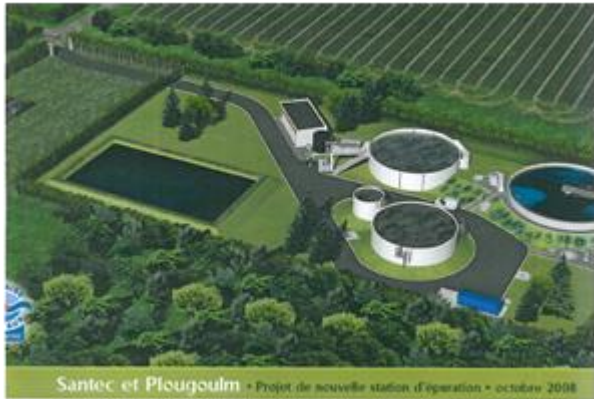
Santec et Plougoum - Projet de nouvelle station d'épuration - octobre 2008

La station d'épuration de Brénesquen qui dessert les Communes de Plougoum et Santec, est arrivée à ses limites de capacité.