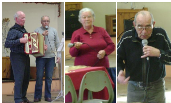
Les chanteurs et les conteurs se sont succédés au micro afin d'offrir à l'assemblée des histoires drôles et des chants en français et en breton